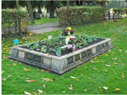
Gerddi Coffa y Gorllewin 1 a 2

Mae mynwent y gorllewin yn cynnig dau fath gwahanol o blac coffa gwenithfaen. Nodwch yr opsiwn sydd orau gennych.