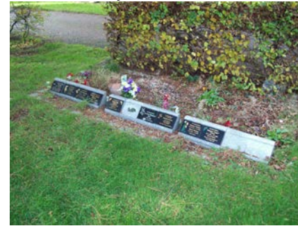
Gardd Goffa y Gorllewin 3